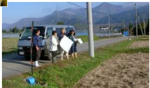
農地の利用状況調査風景

への女性の加入推進、家族経営協定の推進、地域振興等に取り組んでいることと、女性が農業委員として立候補できるような地域づくり、活動を地域ぐるみで支援していけるような地域住民の意識改革をめざしていることが評価されたものです。