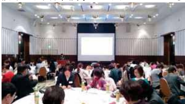
↑17グループに分かれワークショップ

翌日は、ぎふ農業委員会女性ネットワーク主催で、宮津市の由良オリーブを育てる会による耕作放棄地再生とオイル販売などの取組み、宮津市の天橋立ワインの醸造施設やブドウ畑、農家レストランについて視察した。