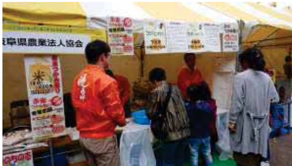
↑お米すくいをする来場者

出展ブースは115（テント、キッチンカー、軽トラ）。本県ブースでは「お米すくい」や「玄米だんご」など、岐阜県農業法人協会会員の商品を販売した。来場者数は2日間で約52,000人。