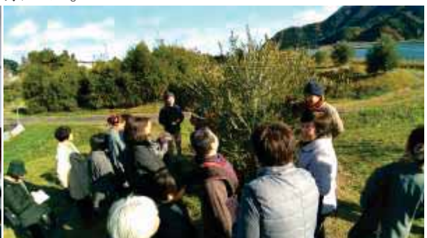
↑宮津市由良地区のオリーブ畑の見学