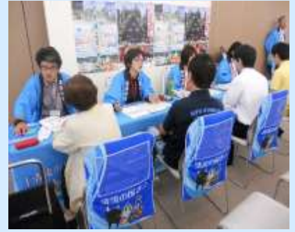
H29.5.20開催 就農・就業相談会 「アグリチャレンジフェア2017」の様子

新規就農者の掘り起こすため、就農・就業相談会や就農支援セミナー、研修会、バスツアー等を開催します。5月20日には岐阜市内において、ぎふアグリチャレンジ支援センターとしては初めてとなる就農・就業相談会「アグリチャレンジフェア2017」を開催し、多くの方に来場いただきました。